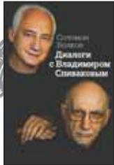
Волков С. Диалоги с Владимиром Спиваковым. М.: АСТ: Редакция Елены Шубиной, 2014. – 320 с. – (Книги Соломона Волкова).

1 «Я знаю Спивакова уже пятьдесят пять лет, ведь мы занимались у одного и того же профессора по классу скрипки в музыкальной школе при Ленинградской консерватории». Из долгих лет дружбы получился разговор двух одноклассников обо всем — о школе, о литературе, о гастролях — тогда и сейчас, о женщинах, о спорте, об искусстве и, конечно, о музыке.