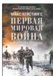
Хейстингс М. Первая мировая война: Катастрофа 1914 года / Пер. с англ. М. Десятовой. М.: Альпина нон-фикшн, 2014. — 604 с.

6 Известный британский журналист, историк и писатель Макс Хейстингс подробно и эмоционально объясняет причины катастрофы, постигшей Европу в 1914 году и позднее получившей имя Первой мировой войны, одной из самых кровавых в истории человечества.