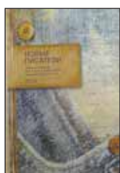
Новые писатели: Проза, поэзия, литература для детей, драматургия, эссе / Сост. В.Коркунов. М.: Фонд СЭИП, 2014. — 512 с.

5 Вот уже 13 лет каждый год в подмосковном пансионате «Липки» собираются литераторы из российских регионов и обширного русского зарубежья — провести плодотворнейшую неделю в рамках программы «Молодые писатели России». Перед нами — очередной результат их увлекательной совместной работы.