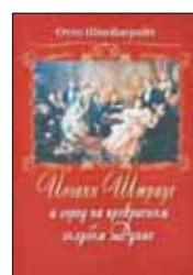
Шнейдерайт О. Иоганн Штраус и город на прекрасной голубой Дунае / Пер. с нем и прилож. Г.Юрчакевич; Вступ. сл. С.Бэлзы. Екатеринбург, Издательский дом «Классика», 2014. — 664 с.: ил.

7 Выпуск книги приурочен к 210-летию со дня рождения Иоганна Штрауса. Отто Шнейдерайт подробно рассказывает о великом композиторе, истории его музыкальной семьи и взаимоотношениях Штраусов и прекрасной Вены — «музыкальной столицы Европы».