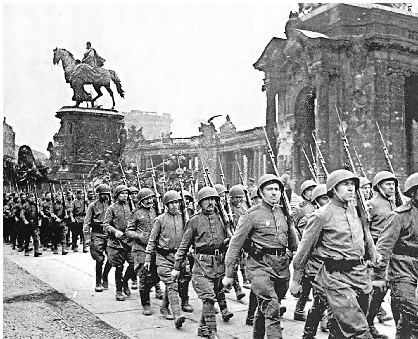
Парад победителей в Берлине в мае 1945 года.